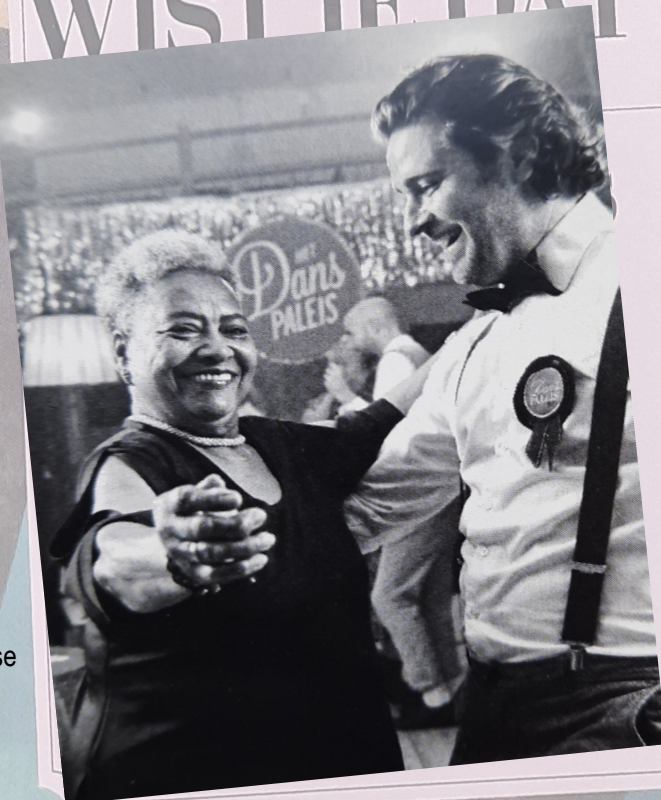
Afbeeldingen: het Danspaleis